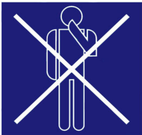
HÄNDE VOM GESICHT FERNHALTEN