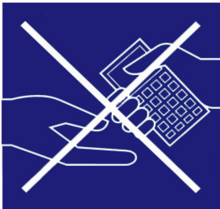
KEINE GEGENSTÄNDE GEMEINSAM NUTZEN