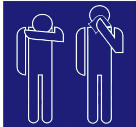
HYGIENISCH HUSTEN UND NIESEN